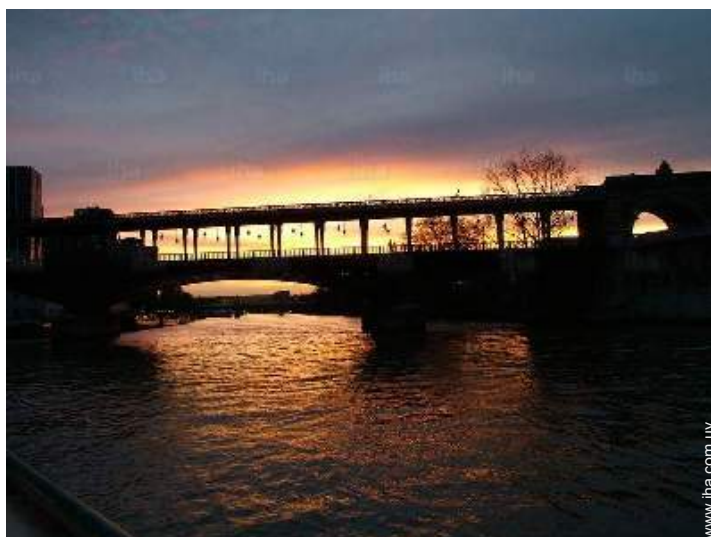
vista sobre la apuesta del sol