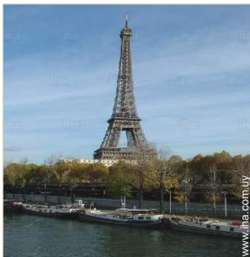
en el muelle