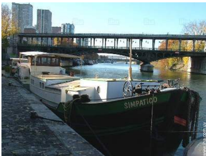
en el muelle