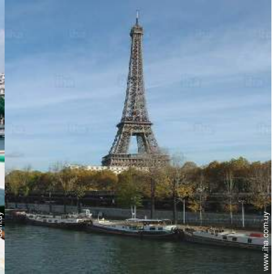
en el muelle