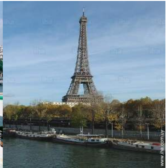
en el muelle