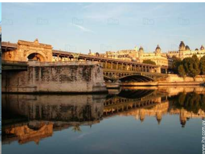
vista sobre el río