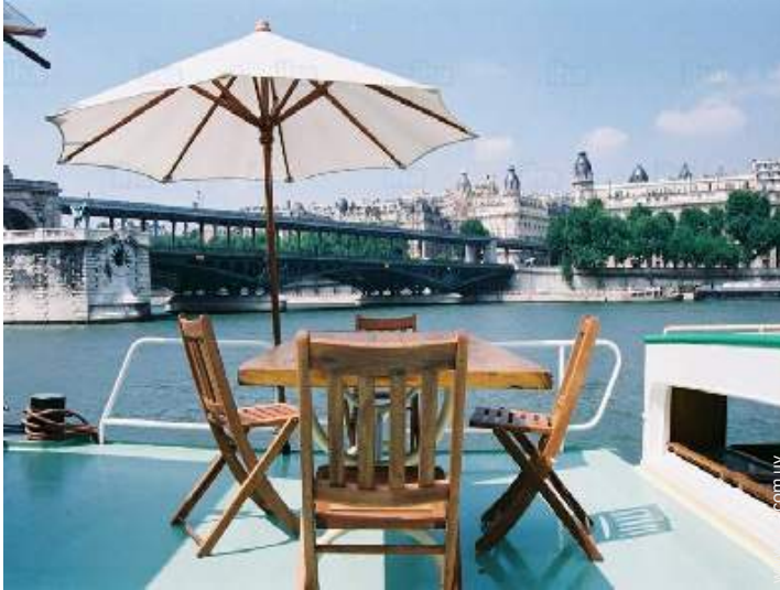
vista sobre el río