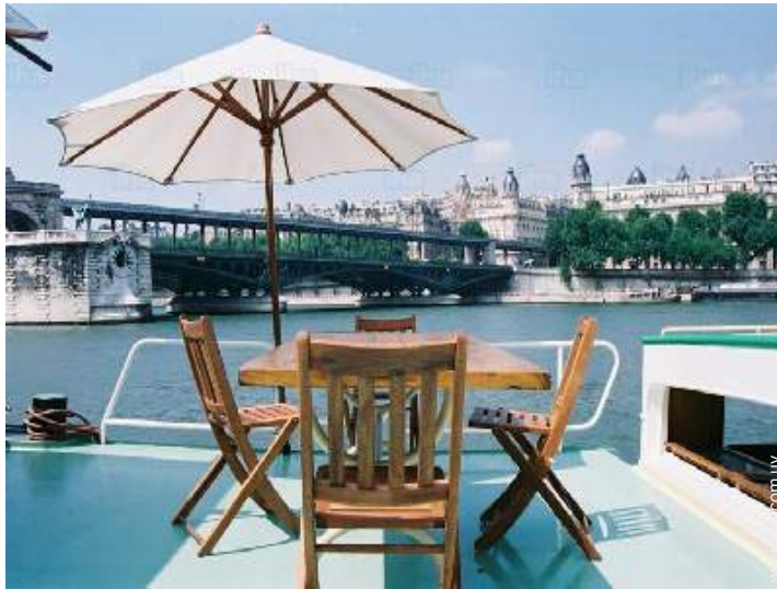
vista sobre el río