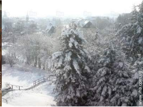
vista sobre el jardin/parque