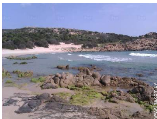
playa de roca