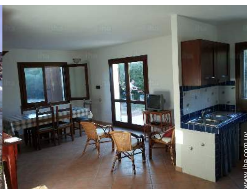
vista desde el cuarto de estar