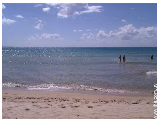
playa de arena