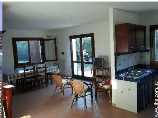
vista desde el cuarto de estar