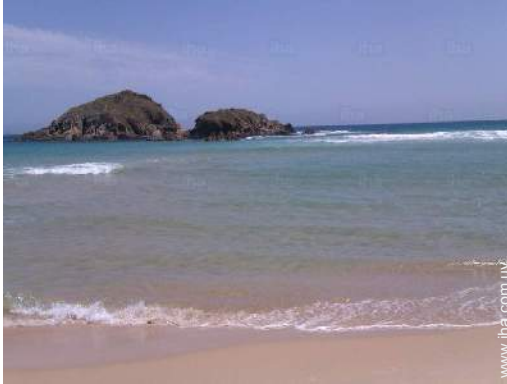
playa de arena