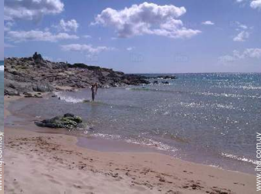
playa de arena