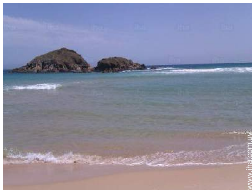
playa de arena