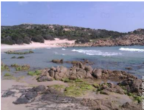
playa de roca