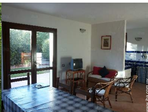
vista desde la cocina