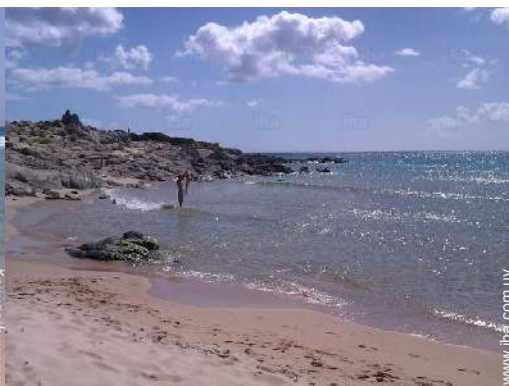
playa de arena