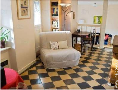
sofá cama 1 pers