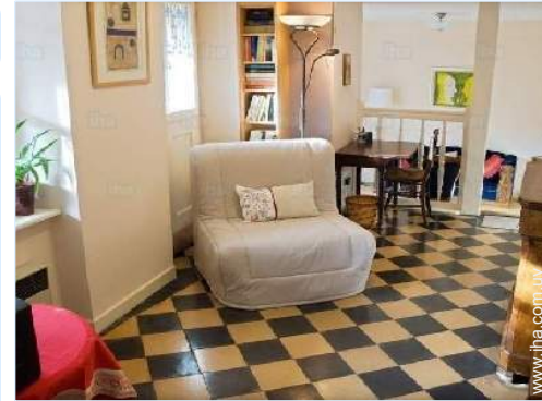
sofá cama 1 pers