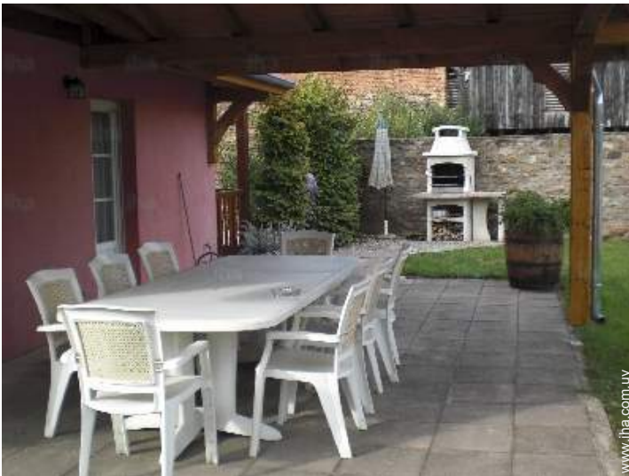
mesa(s) de jardin