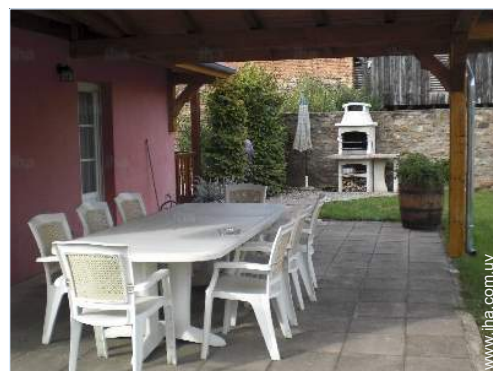
mesa(s) de jardin