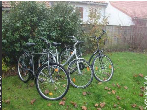
instalación de ocios