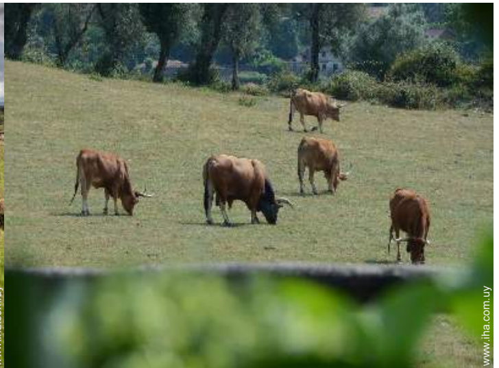
animales de la granja