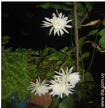
vista desde la terracea cubierta