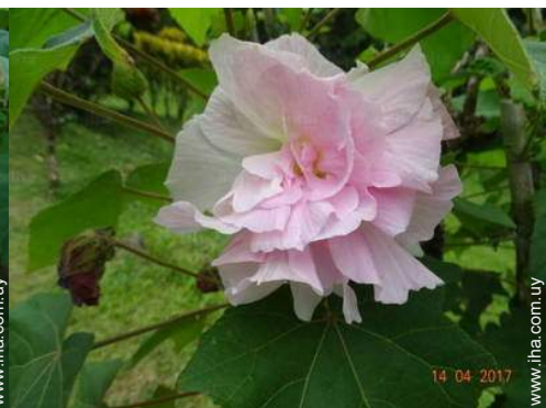
vista desde la terracea cubierta