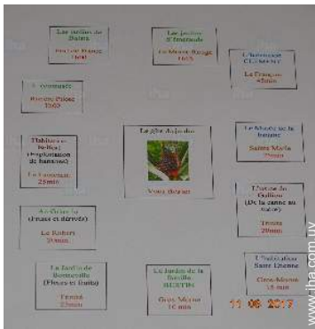
parque y jardín