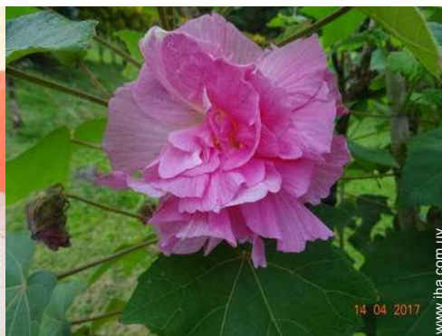
vista desde la terracea cubierta