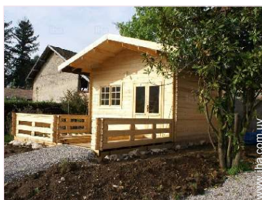
Cabaña Bungalow con Encanto