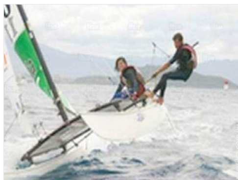
actividades balnearias cercanas