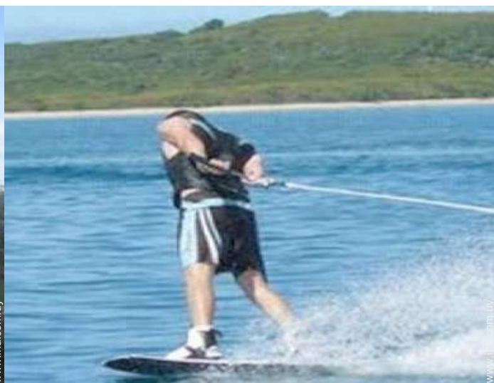
actividades de ocio cercanas