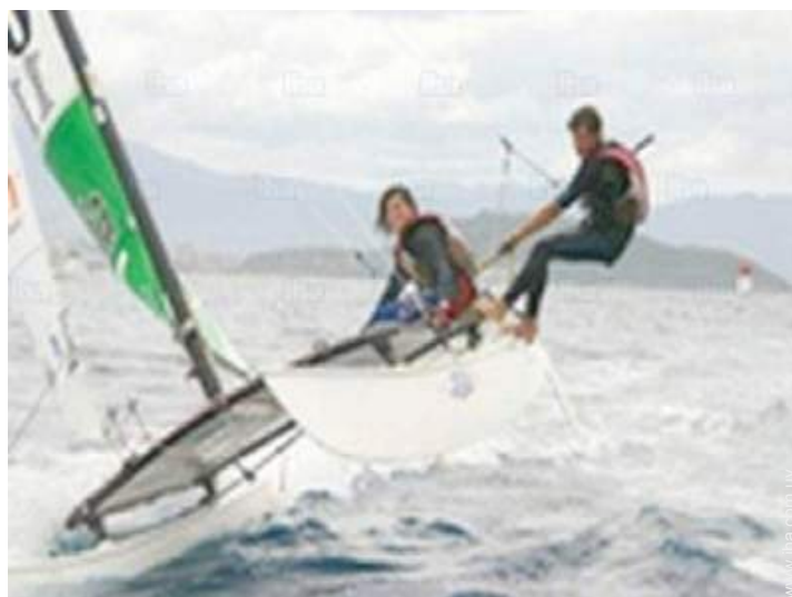
actividades balnearias cercanas