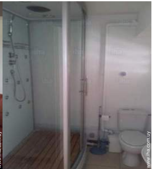
Instalaciones a disposición