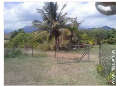
vista sobre el campo