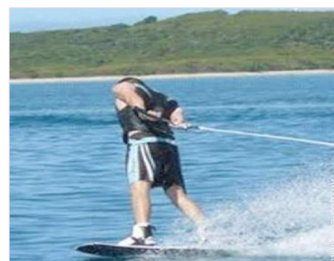
actividades de ocio cercanas

Centro del pueblo 500m El centro 10km Parada/estación de guagua 800m Pequeños comercios 500m