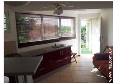
vista desde la cocina